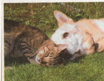
Seltene Liebe: Kater Sandokan schmust mit Mischling Max.

■ Gütersloh. Sandokan kann kaum sehen, schwer hören, konnte so gut wie gar nicht fressen. Dass es sich lohnt, für ein schwer krankes und behindertes Tier alles zu versuchen, zeigt das Schicksal des kleinen Katers. Spenden nach einem Aufruf der NW ermöglichten eine kostspielige Operation.