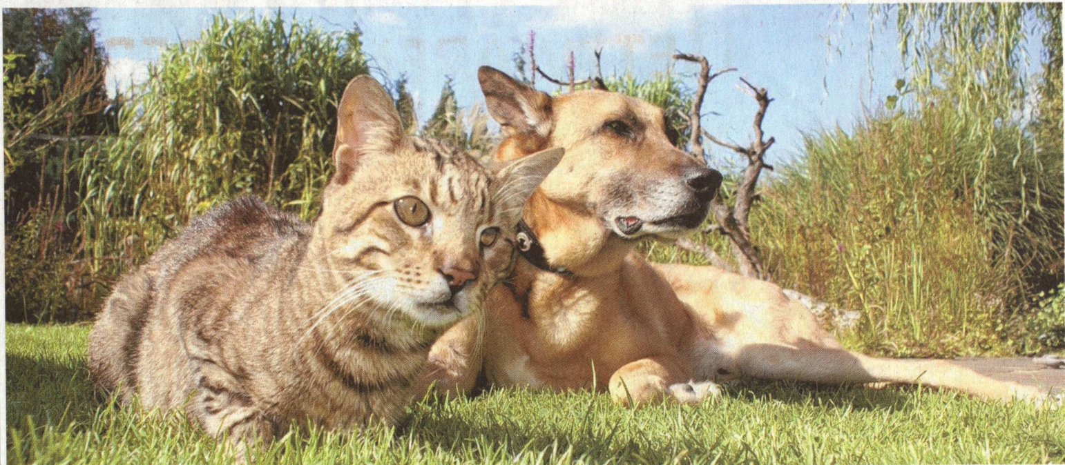
Freunde für den Rest des Lebens: Sandokan und Max. Nach ihren Operationen haben beide eine gute Chance, noch ein paar Jahre zusammen zu verbringen.